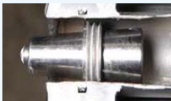
Hydraulic activated plug